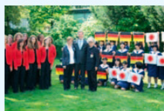
ハノーバー少女合唱団と徳島少年少女合唱団の交流

Oberschullehrerin aus Tokushima unterrichtet Japanisch an niedersächsischen Schulen und stellt die Kultur Japans und Tokushimas vor