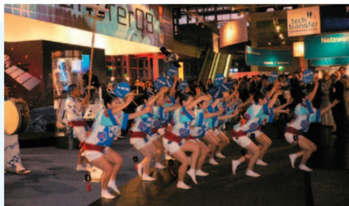
2008年のハノーバー・メッセ:徳島ブース開設、メッセ文化行事で「大塚連」が阿波踊りを披露

Das Land Niedersachsen und die Präfektur Tokushima unterstützen die partnerschaftliche Zusammenarbeit in verschiedenen Bereichen wie Wirtschaft, Kultur, Bildung und Sport. Auch zwischen den Hochschulen werden vielschichtige Austauschprojekte durchgeführt. Einige Beispiele: