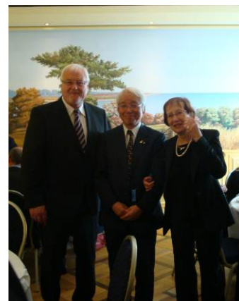
von links: Ministerpräsident a.D. Peter Harry Carstensen, Gouverneur Toshizo Ido, Ministerpräsidentin a.D. Heide Simonis

Zum Abendessen, gegeben von der japanischen Seite, war Ministerpräsident a.D. Peter Harry Carstensen, dessen temperamentvoller Japan-Besuch vom Mai 2006 noch vielen in bester Erinnerung ist, als besonderer Ehrengast geladen. Bei dieser Gelegenheit überreichte ihm der Gouverneur ein Anerkennungsschreiben der Präfektur Hyogo. Ebenfalls zugegen war Ministerpräsidentin a.D. Heide Simonis, in deren Amtszeit der Abschluss Partnerschaft zwischen Hyogo und Schleswig-Holstein im Jahr 1997 fällt.