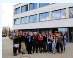
徳島県の高教員が、ニーダーザクセン州の学校で、日本語指導及び日本や徳島の文化紹介

Oberschullehrerin aus Tokushima unterrichtet Japanisch an niedersächsischen Schulen und stellt die Kultur Japans und Tokushimas vor