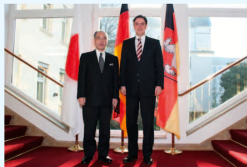
デイヴィッド・マックアリスターニーダーザクセン州首相と神余隆博在ドイツ大使が2011年3月3日にハノーバーにて州と県の交流について会談

Begegnungen des Mädchenchores Hannover mit dem Jugendchor Tokushima