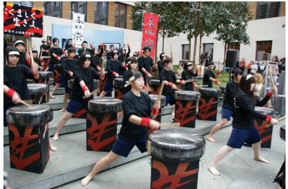
Temperamentvolles Konzert im Auswärtigen Amt

Die Kinder im Alter zwischen 12 und 14 Jahren haben aus der Not heraus Trommeln aus Autoreifen selbst gebaut und diese Instrumente haben sie in ihrem Reisegepäck mitgebracht.