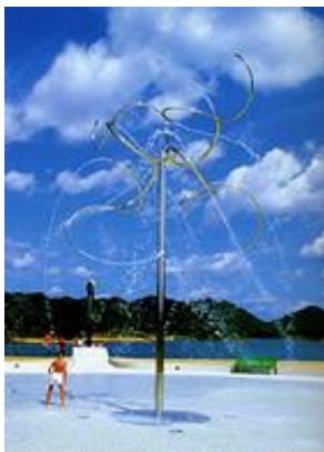
„Baum des Wassers“ in der Präfektur Hyogo

Ausgestattet mit Helm und Sicherheitsgurt war er für einige Zeit dort tätig und lernte dabei, nach dem vergleichsweise lockeren Leben in Rom, Disziplin und neue Prinzipien kennen.