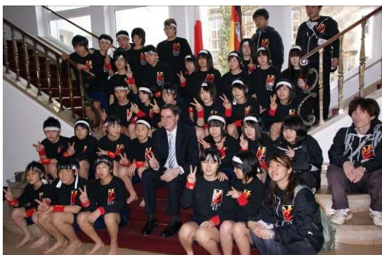
Zusammentreffen mit dem niedersächsischen Ministerpräsidenten David McAllister in der Staatskanzlei

Das Projekt sollte dazu dienen, dass die Kinder einen Abstand von der Katastrophe nehmen und auch um die noch existierenden Schmerzen zu überwinden. Ferner können sie und wir für die vielen Unterstützungen der deutschen Bürger zugunsten der Opfer auf diese Art danken. Wir freuen uns, dass das Projekt den Zweck in der Tat voll erfüllt hat.