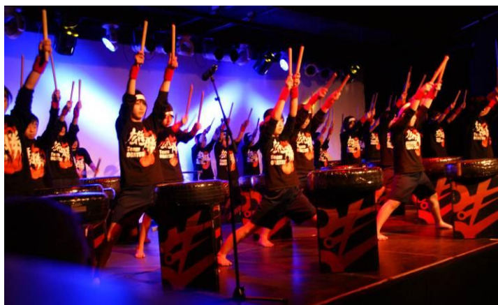
Großer Auftritt in Wolfsburg

bereiten“. Ich stellte die warmherzige Frau den Kindern im Bus vor. Die Kinder bedankten sich dafür bei ihr ganz herzlich. Darüber hat die Dame sich sehr gefreut.