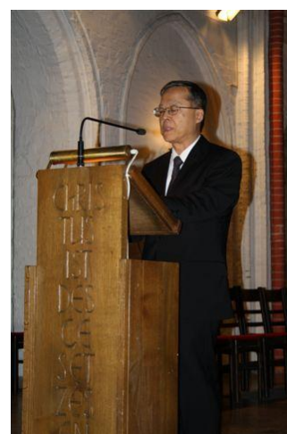
Generalkonsul Setsuo Kosaka begrüßt die Gäste

Am 15. März 2012 baten das Japanische Generalkonsulat Hamburg und die Deutsch-Japanische Gesellschaft Hamburg e.V. zu einem Japanisch-Deutschen Musikabend anlässlich des 1. Jahrestags der Naturkatastrophe in Japan in die Hauptkirche St. Jacobi. Vier Künstler hatten ihr großes Können entgegenkommend zur Verfügung gestellt und für die rund 180 Gäste ein dem nachdenklich stimmenden Ereignis angemessenes Programm zusammengestellt. Kirchenmusikdirektor Rudolf Kelber ließ es sich nicht nehmen, auf der berühmten Arp-Schnitger-Orgel der Kirche Bach zu intonieren und damit für eine gewaltig klingende Introduction zu sorgen. Wesentlich intimer klangen dagegen die Lieder von Franz Schubert, Johannes Brahms, Hugo Wolf sowie der japanischen