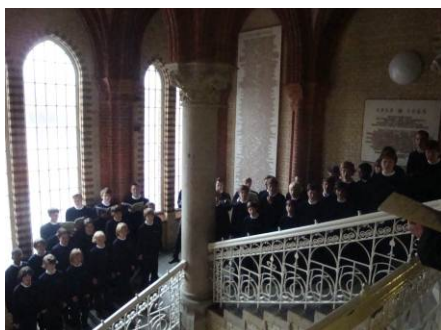
Gesangsdarbietung des Kieler Knabenchors (oben) Blick in die Aula (Mitte oben)

Insgesamt wurde mit der Feierstunde ein wichtiges Kapitel der japanisch-schleswig-holsteinischen Beziehungen, nämlich die bewusste Heranführung des Nachwuchses auf Schulebene an international ausgerichtete Aufgaben, besonders hervorgehoben und der Öffentlichkeit präsentiert.