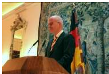
Finanzsenator Dr. Peter Tschentscher übermittelt die Glückwünsche des Senats