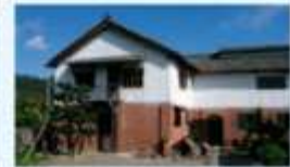
ドイツ人の家

ベートーヴェン「第九」：捕虜が行っていた文化活動のなかで、日本で広く知られるようになったのが、ルードヴィヒ・ファン・ベートーヴェンの「交響曲第九番」が演奏されたコンサートです。1918年6月1日、アツア初の自由演奏が板東俘虜収容所で行われました。