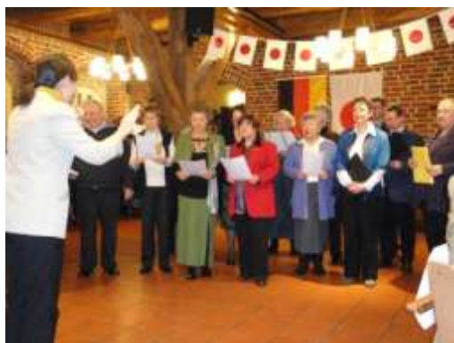
Der Lüneburger Naruto-Chor in Aktion