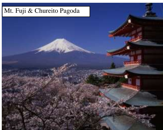
Mt. Fuji & Chureito Pagoda

Der Gegensatz zwischen den dynamischen, hochmodernen Großstädten und der uralten, aber sehr lebendigen Tradition und Kultur macht den Reiz aus, den Japan auf die meisten Besucher aus Deutschland ausübt.