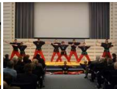
Ju-Jutsu als Unterhaltungsprogramm: dargeboten vom Ju-Jutsu Showteam der Hausbruch-Neugrabener Turnerschaft