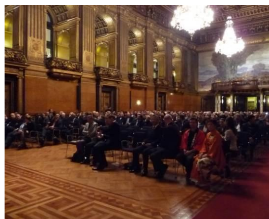
Ein Blick auf die große Gästeschar im Großen Festsaal des Hamburger Rathauses während des Festaktes zum Eisbeinessen