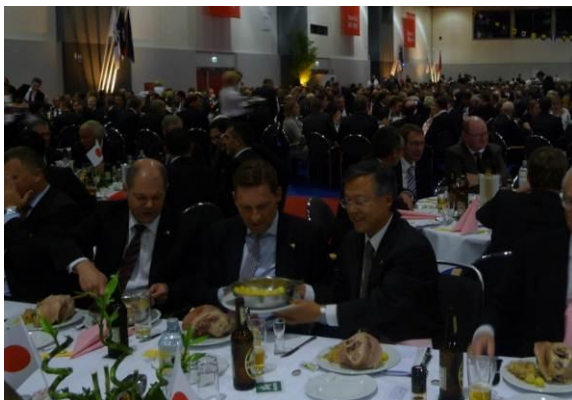
Erster Bürgermeister Olaf Scholz, Verbandspräsident Christian Koopmann und Generalkonsul Setsuo Kosaka greifen zu

Das traditionelle Treffen der Schiffsmakler im CCH rückt Hamburg jährlich ins Zentrum der Schifffahrtswelt. Das von der Vereinigung Hamburger Schiffsmakler und Schiffsagenten e.V. (VHSS) am 4. November 2011 ausgerichtete Eisbeinessen wurde mit wuchtigen Klängen von Taiko-Trommeln eröffnet und konnte einen neuen Besucherrekord melden. Über 5200 Gäste aus 50 Nationen nahmen am Eisbeinessen teil, das erstmalig 1948 stattfand. Für Reeder, Schiffsmakler, Verladere, Spediteure,