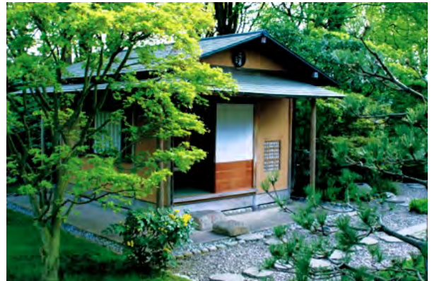
Japanisches Teehaus im Stadtpark Hannover

Da es sich um ein Jubiläumsfest anlässlich des 20jährigen Bestehens der DJG handelt, dürfen sich die Besucher auf ein besonders spektakuläres Programm mit vielen kulturellen Aktivitäten freuen. Parallel zum Sommerfest findet im Eingangsfoyer des Congress Centrum am 11. und 12. Juli eine Ikebana-Ausstellung dreier Stilrichtungen statt. Das große Ereignis bietet gleichzeitig einen angemessenen Rahmen für die Regionaltagung Nord der Deutsch-Japanischen Gesellschaften, zu der die DJG Hannover CHADO-KAI e.V. als Gastgeberin Teilnehmer aus ganz Norddeutschland erwartet.