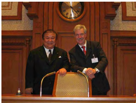
Yoshihiro Funato, neu gewählter Stadtpräsident v. Osaka, und Bürgerschaftspräsident Berndt Röder

Mit Eröffnung der Ausstellung „Twinism“ und einem Bankett im Rihga Royal Hotel wurde Anfang Juni in Osaka fortgesetzt, was im Mai mit dem Empfang im Rathaus und dem Kirschblütenfest in Hamburg begonnen hatte: Der festliche Reigen zum 20jährigen Jubiläum der Städtepartnerschaft Hamburg-Osaka.