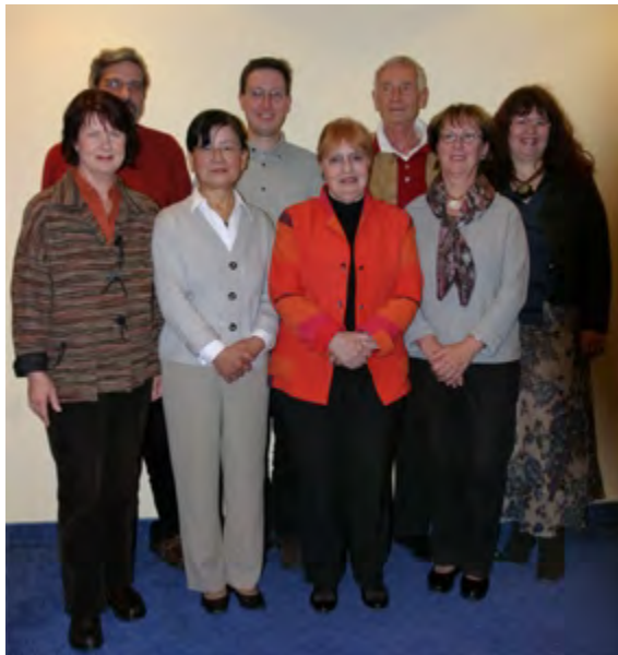
Der aktuelle Vorstand der DJG Hannover-Chado-kai e.V.

'Engagierte Bürger haben die Initiative ergriffen, um ihre Liebe für Japan und ihr tiefes Wissen über dieses Land an andere weiterzugeben. Vielgestaltige Aktivitäten beweisen, wie bereichernd es sein kann, sich mit dem alten und modernen Japan zu