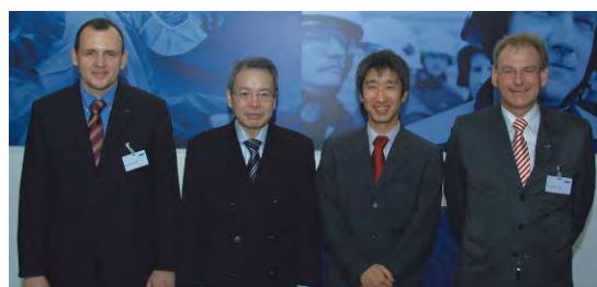
Besuch im Drägerwerk