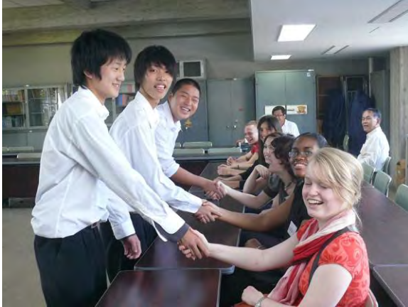
Besuch der 1. Städtischen Oberschule

Higasa kennen. Auch konnten die Schüler hier schon erste Kontakte zu den Gastfamilien knüpfen, die von der Universität in enger Zusammenarbeit mit dem Rotary Club geworben worden waren.