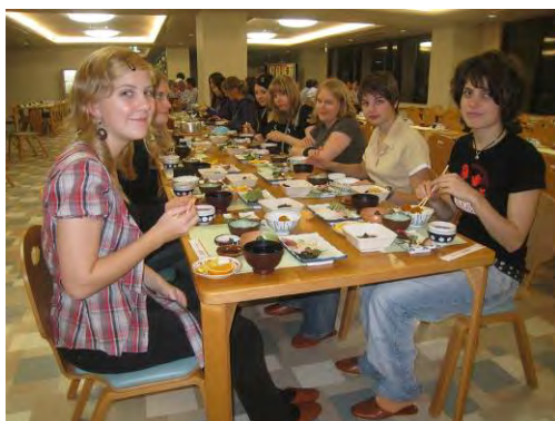
Übernachtung im Zentsuji-Tempel

Mit insgesamt 4 Tagen Aufenthalt in Osaka war natürlich auch genügend Zeit für umfangreichere Besichtigungen der historischen und modernen Sehenswürdigkeiten Osakas, für einen Tagesausflug nach Kyoto oder für eine ultimative Shopping-Tour vor dem Heimflug.